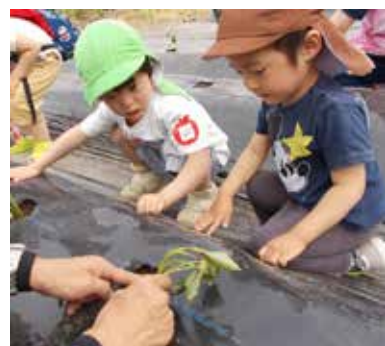
さつまいもの苗って こうなってるんだ~!

5月29日に、常田保育園のお友だちと一緒に信州大学の畑にてさつまいもの苗植えを行いました!