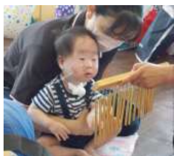
音楽療法で聞いた鈴の音。 涼しさを感じました。

まだまだ暑い日が続いていますね。 お友達はどんなことをして楽しんでいたのかな？少しずつご紹介します♪