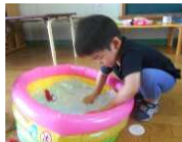
ひんやりして ずっと乗って いたいな。