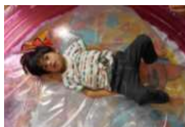
☆ウォータークッション☆