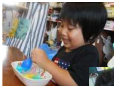
寒天遊び！ 不思議な感触に 夢中です！