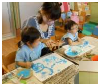
絵の具が付いても へっちゃらだよ♪