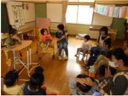
みんなであいさつ 「今日はよろしくね！」

9月26日(土)に年長行事を行いました。今回は運動会ごっこに向けて、横断幕作り！更にお家へのお土産として、巾着も作りました。