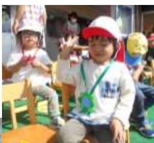
メダルをプレゼント！