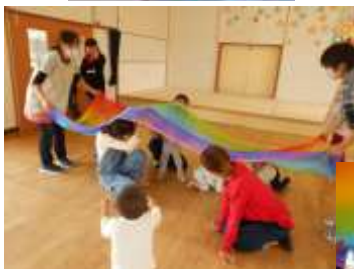
虹色の布をひらひら。 歓声があがりました。