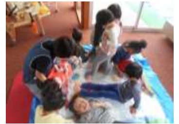
布とビニール袋で絵の具を挟んで、 上から踏んで伸ばしてみよう♪