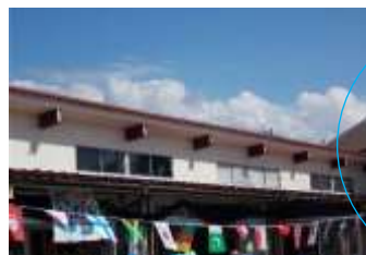
素敵な青空。 年長さんが作っ た横断幕も、見守 っていました。