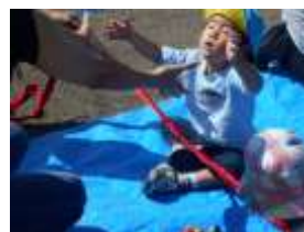
お化けの 口に入れ ちゃえ～！