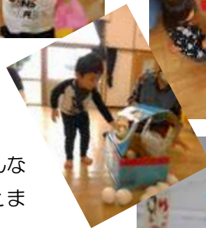
玉入れに紙吹雪、みんな の笑い声が沢山聞こえま したね♪